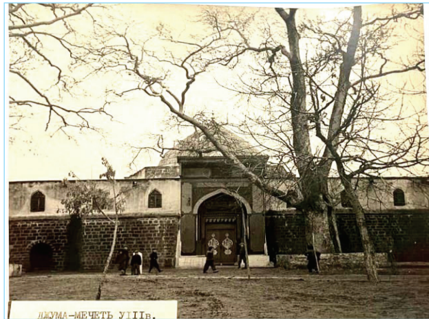
Дагестанская АССР г. Дербент Джума-мечеть 30.01.1957 г. ДМЗ- НВМ-2038

Старожилы Дербента вспоминают, с каким трудом им приходилось очищать мечеть от тюремной скверны. Причем ее