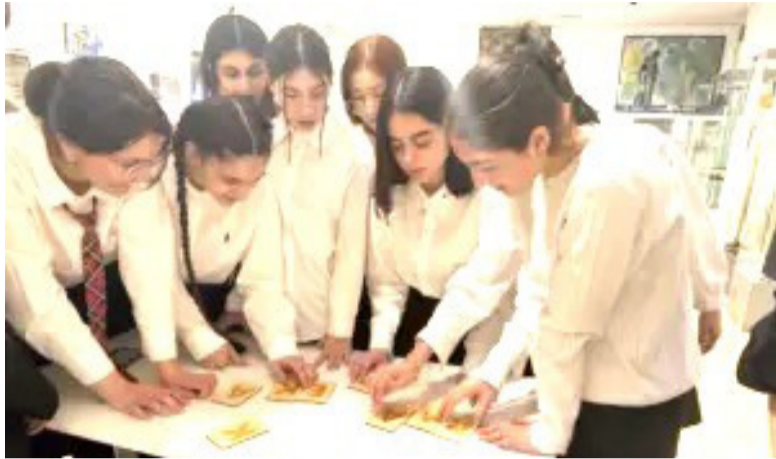
Тренинг состоялся в рамках РД «Комплексная программа Государственной программы противодействия идеологии терроризма в Республике Дагестан»

«В единстве - наша сила» - под таким девизом прошёл в Музее истории мировых культур и религий тренинг, посвящённый важной и актуальной теме - сплочённости, взаимопониманию и силе команды.